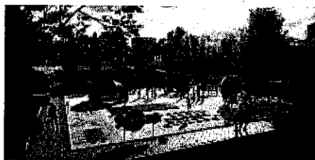
NIVEA PODWÓRKA wizualizacja.jpg 3395K